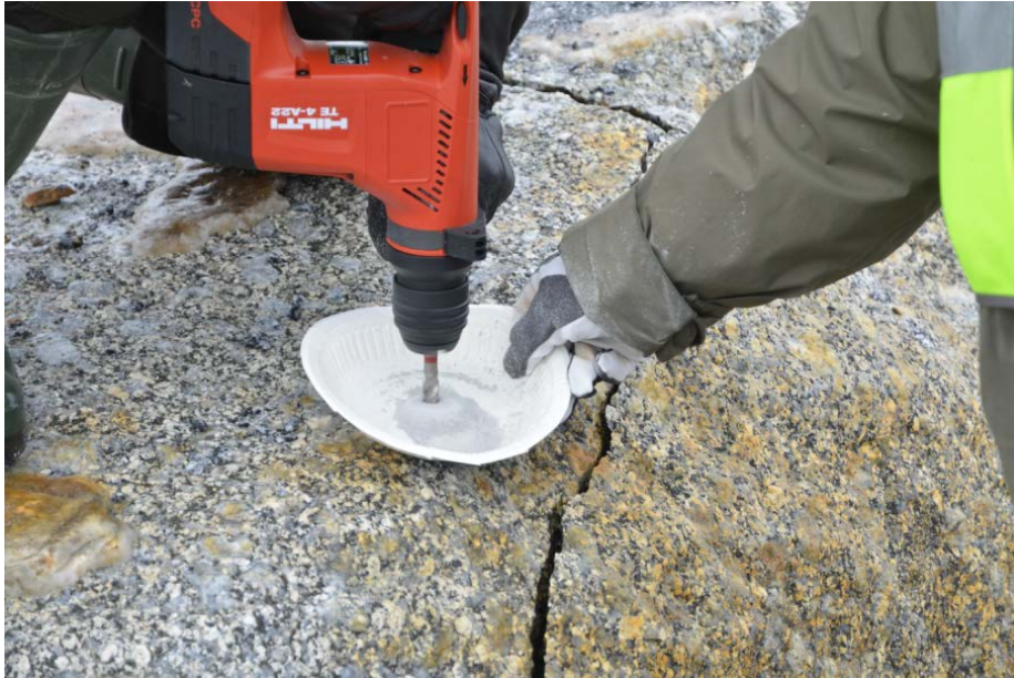
Kuva 1. Porasoijanäytteenotto akkuporavasaralla.