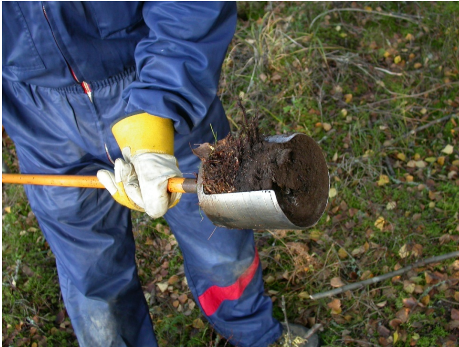
Kuva 2. Humusnäytteenotin.

Näytteet pakataan huolellisesti kuljetusta varten ja toimitetaan laboratorioon analysoitavaksi.