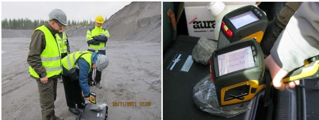
Kuva 3. Maaperänäytteen arseenipitoisuuden mittausta XRF-laitteella.

Kaikki, myös osanäytteiden mittaustulokset kirjataan ylös samaan paikkaan näytteiden tunnistetietojen ja muiden dokumentoitujen tietojen yhteyteen.